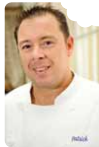
grey shrimp croquettes Patrick Vandecasserie for La Villa Lorraine