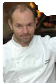
roasted filet of cod, cauliflower carpaccio and cream of speculoos Pascal Devalkeneer for Le Chalet de la Forêt

Cut the croquettes into the shape you want, coat them with breadcrumbs and then deep-fry them at 180°C. Serve with fried parsley.